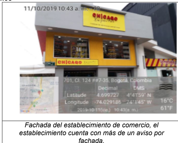
Fotografía No. 2